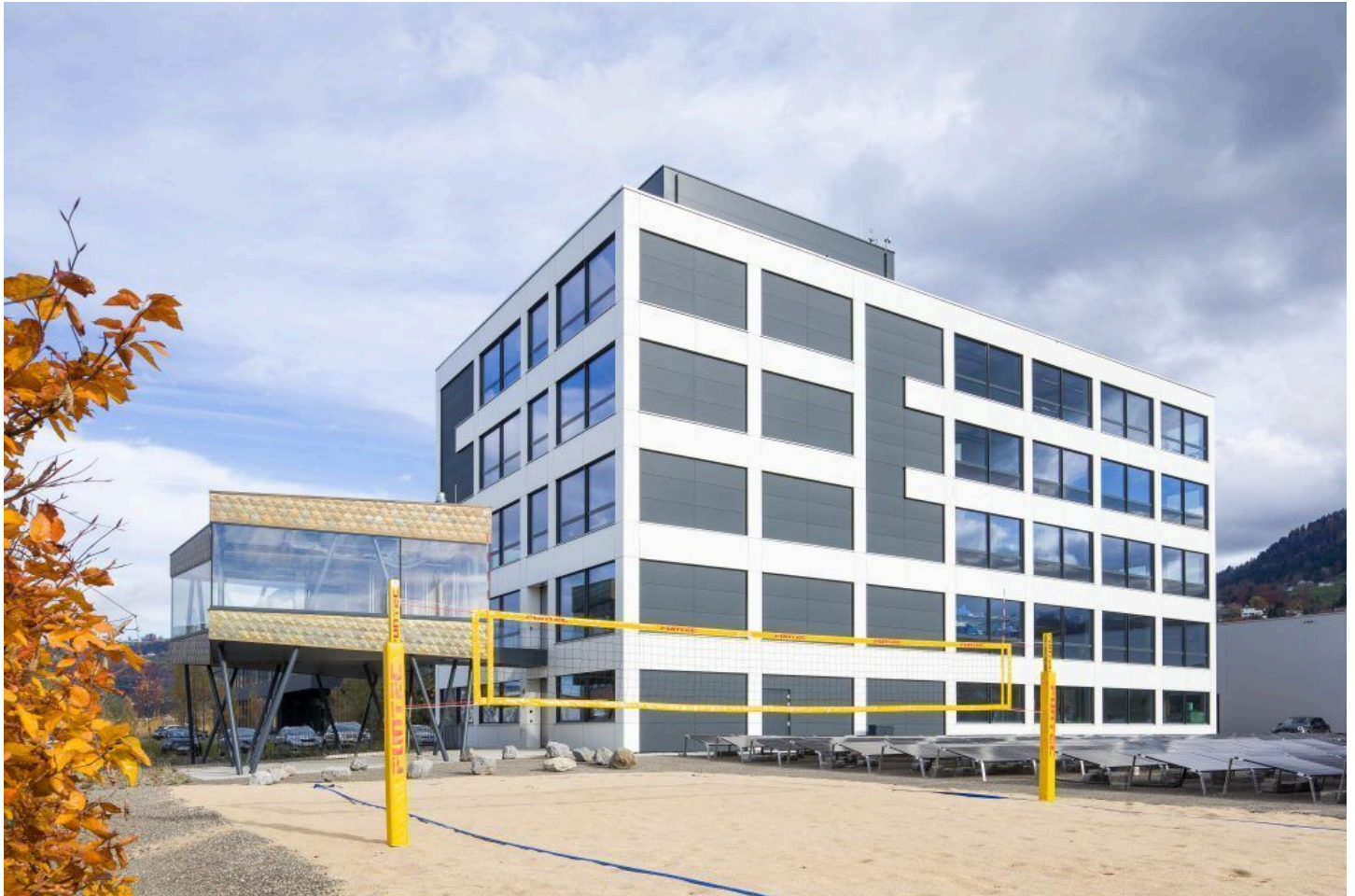
Das neue Firmengebäude der innovativen Firma: Vorne der Beachvolleyballplatz und daneben die PV-Anlage. FA

tenpunkte, “ein Spielplatz für Große und Nährboden für unser eigenes Handwerk”, so die Geschäftsführer, das eigene Rechenzentrum bietet “Sicherheit und Stabilität unter eigener Kontrolle”, darüber laufen die IoT-Dienste, Infrastruktur und Teleworking. Selbstverständlich wird auch mit entsprechender PV-Anlage die Energie selbst hergestellt.